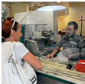
CAOS Per un guasto al computer

PROTESTE e polemiche lunedì da parte dei cittadini in attesa di un prelievo di sangue nell'ambulatorio del Distretto sanitario di via Da Verrazzano, a Figline, gente che già si era presentata sabato mattina ma che a causa di un guasto del sistema informatico dell'Azienda sanitaria era stata rimandata a inizio settimana. Al banco dell'accettazione ci sono due computer che consentono agli operatori di elaborare le ricette con le richieste di analisi e stampare quanto serve per effettuare il